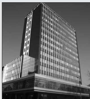
Niederlassung von AXA IM in Frankfurt

Als Multi-Experte im Bereich Asset Management ist AXA Investment Managers in der Lage, einzelne Anlageklassen zu für den Kunden maßgeschneiderten Investmentlösungen zu kombinieren und damit einen signifikanten Mehrwert zu erzielen. So möchte AXA IM in jedem Bereich Marktstandards setzen und eine führende Position einnehmen. Das Unternehmen ist davon überzeugt, dass Spezialisierung, Unabhängigkeit und Verantwortlichkeit der Fondsmanager für eine nachhaltige Wertentwicklung unerlässlich sind. Deshalb baut AXA IM überall dort Expertenteams auf, wo es über klare Wettbewerbsvorteile verfügt.